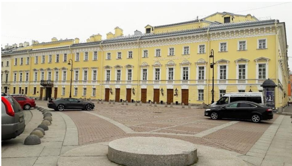
Фото 1. Объект культурного наследия федерального значения «Театр Михайловский», 1831-1833 гг., г. Санкт-Петербург, площадь Искусств, дом 1, литера А (сведения в соответствии со сведениями из Единого государственного реестра объектов культурного наследия). – Источник: здесь п. 11.1

фотографическое изображение объекта, 2025 г.